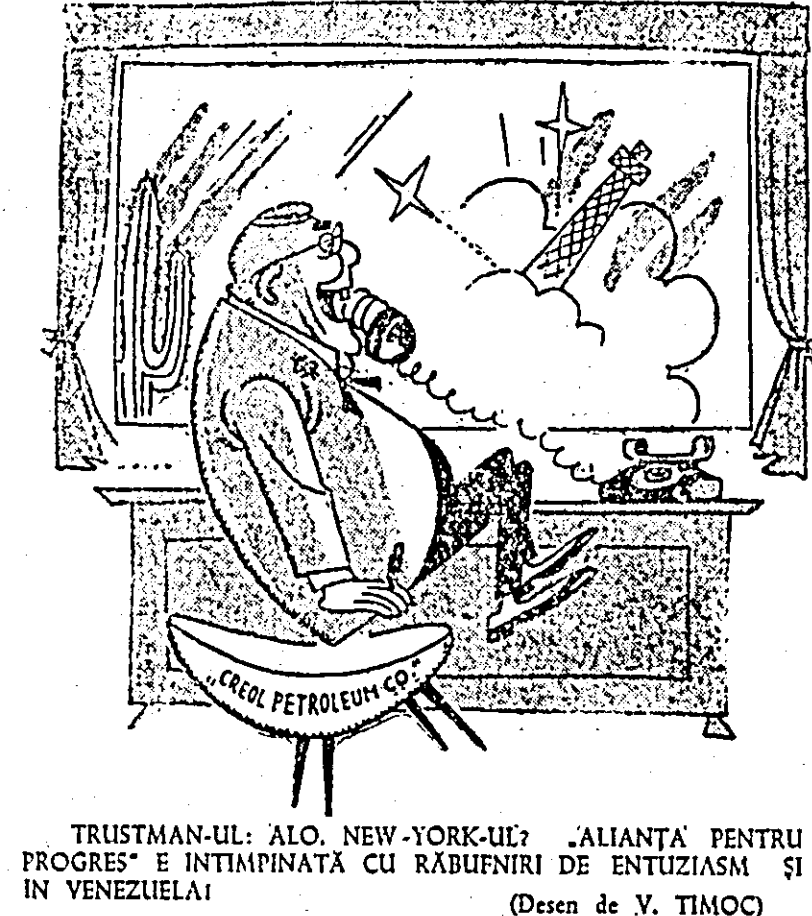
(Desen de V. TIMOC)

VIENNA. La Vienna a fost format Comitetul pentru desfășurarea "marșului pentru pace și dezarmare", care va avea loc la 15 aprilie. Din comitet face parte 36 de oameni de știință, scriitori, compozitori, fruntași pe tărîm obștească din Austria.