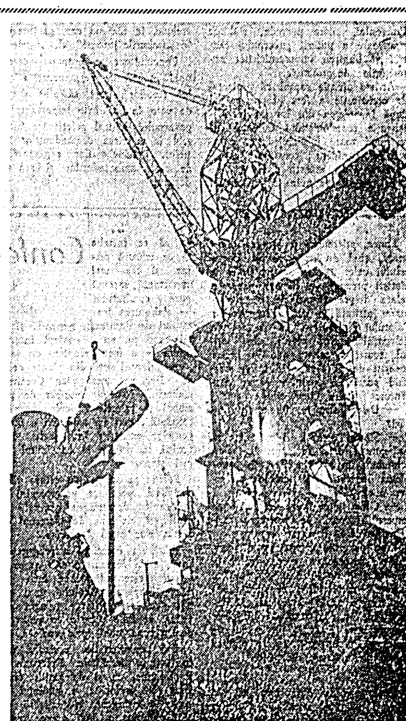
Cu cîteva zile înainte de trecerea în noul an 1963 la Uzina metalurgică „V. I. Lenin” din Jdanovsk s-a terminat construcția unui furnal puternic. La construcția acestui furnal au contribuit comsomolștii din toată țara. Construcția a fost numită pe drept cuvînt o realizare udrnică a Comsomolului.

3.000 de kilometri de canale de irigație și de anasare, 5.000 de locuințe, precum și școli și instituții medicale. Construirea sistemului de irigație a trezit la viață 70.000 de hectare de terenuri, pe care se cultivă acum bumbac, se dezvoltă creșterea vîrștilor de