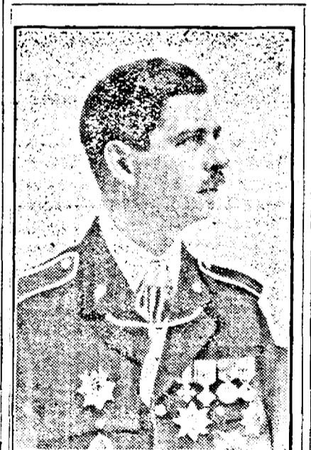
M. S. Regele Carol II.

România nu a avut decât foloase din cauza aceasta.