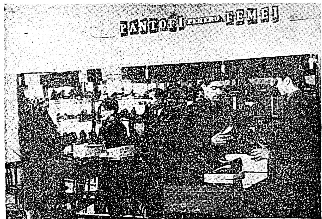
Noul magazin „Dureflor” nr. 36 din Aradul Nou este bine aprovizionat cu un sortiment bogat de încălțăminte, bucurîndu-se de popularitate.

După cum se vede, există deci garanția că sarcinile ce revin cooperativelor din Aradul Nou în ce privește sporirea producției de legume se vor putea îndeplini cu succes contribuindu-se în acest fel la o mai bună aprovizionare cu legume a populației orașului nostru. I. DARULA