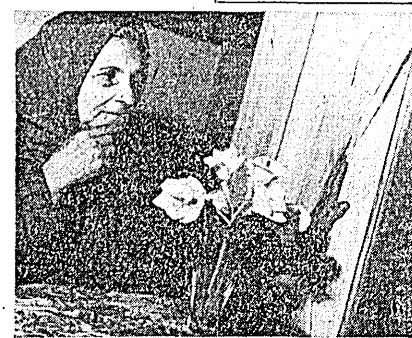
Nimic pe lume nu-i mai urît decît singurătatea...

— Și în cite camere au crescut? — În una singură, așa cum au crescut majoritatea copiilor de la țară. — Și ai ajuns toți mari și sănătoși? — Toți. Azi e însă cu totul altceva. Sîntem doar în 1967! — Sîntem, dar tot familia, familia cu copii a rămas temelia societății. Și focul pentru că sîntem în 1967, cînd vedem conturate visele altor generații, se cere să avem urmași mulți și vrednici, care să ducă mai departe și să împlinească începuturile noastre. — O să ne mai gîndim... Alte 18 persoane cu care am discutat, femei și bărbați, căsătoriți de 6—15 ani, care nu au încă copii, ne-au răspuns în termeni asemănători. Răspunsuri con-