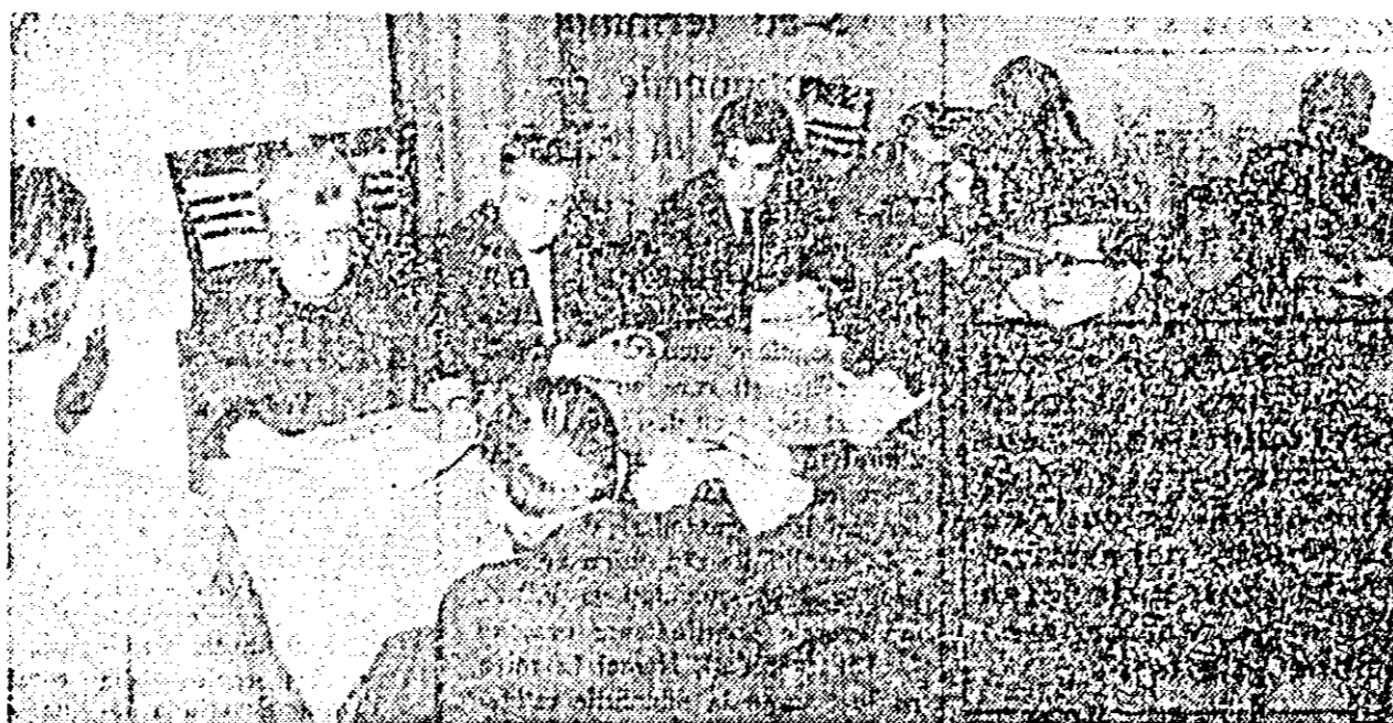
IN CLIȘEU: aspect de la o ședință de lucru a cercului literar „Al. Sahia“

Ziarul nostru consacră această pagină aniversării a două decenii de activitate a cercului literar „Alexandru Sahia“ din Arad, urînd totodată spor la muncă pe tărîm literar tuturor membrilor săi.