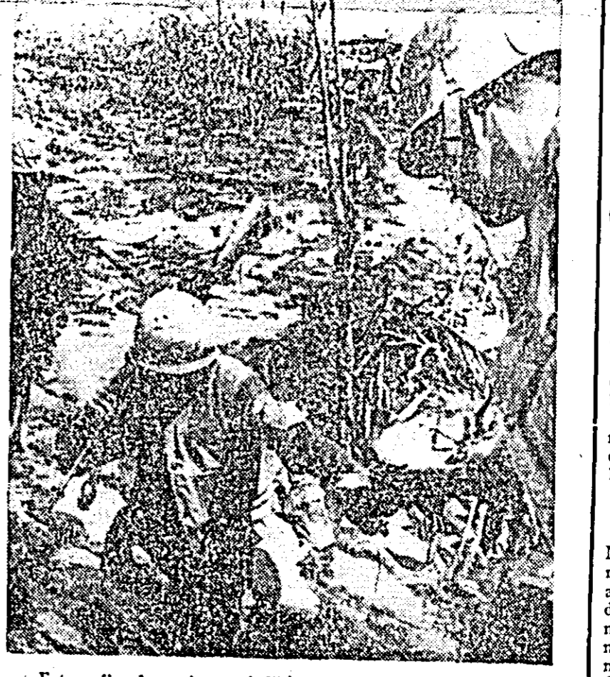
Fotografia de mai sus înfățișează un grup de militari ai SUA, participanți la luptele din delta Mekongului. Aparatul a înregistrat pe peliculă un grup de pușcași marini americani ai companiei Alfa împotmolindu-se în pasta brună și viscoasă a apelor revărsate. Aceasta împotmolire are valoarea unui simbol — este oglindirea situației fără leșire a politicii agresive a SUA în Vietnam.

Cei trei cosmonauți urmau să efectueze un zbor între 10 și 14 zile în spațiu, cabina „Apollo” sînd o reproducere exactă a celeia cu care Statele Unite intenționează să trimită în Lună un echipaj uman înainte de anul 1970. Ca urmare a acestui accident, lansarea cabinei „Apollo-1” a fost amînată sine-die.