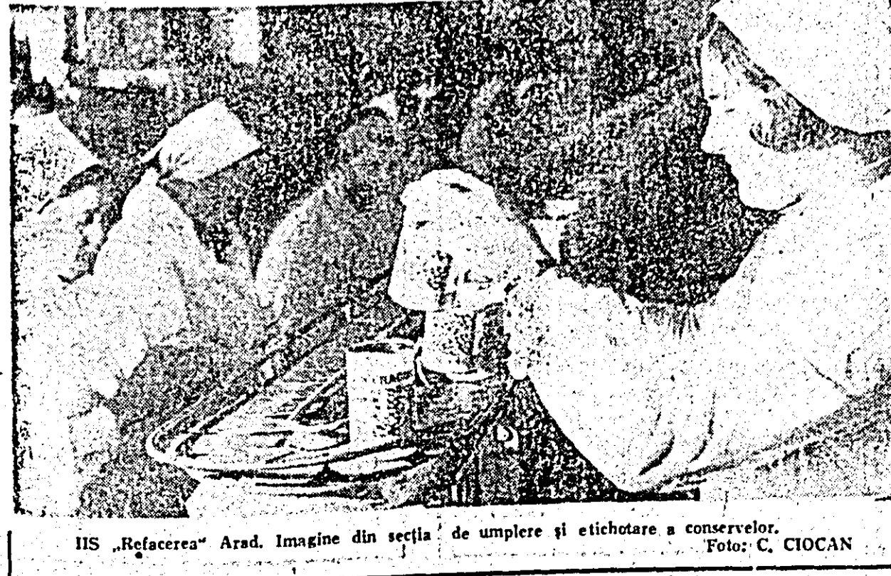
IIS „Refacerea” Arad. Imagine din secția de umplere și etichetare a conservelor.