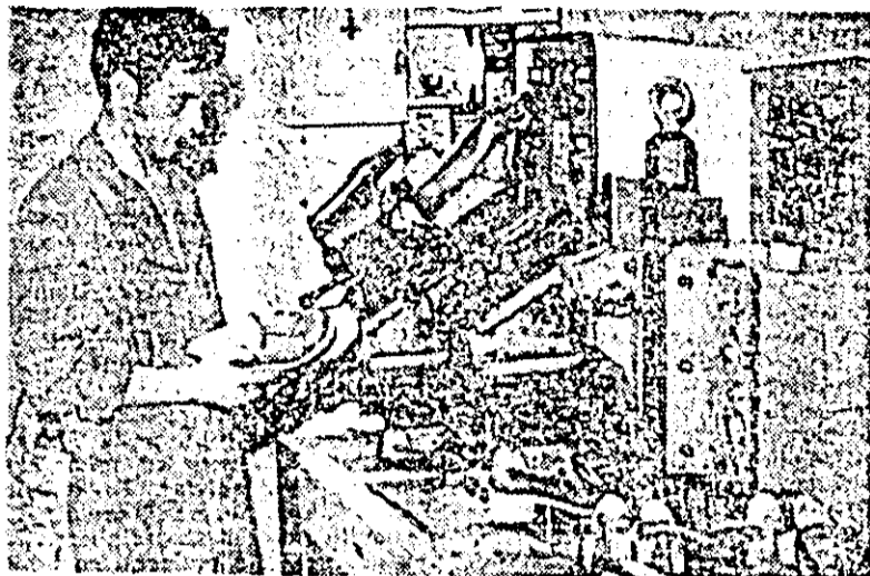
Expresie a preocupărilor pentru sporirea calității și eficienței producției, la întreprinderea „Libertatea” a fost dată în exploatare o mașină de înțecat țalpi care asigură o creștere considerabilă a productivității muncii.