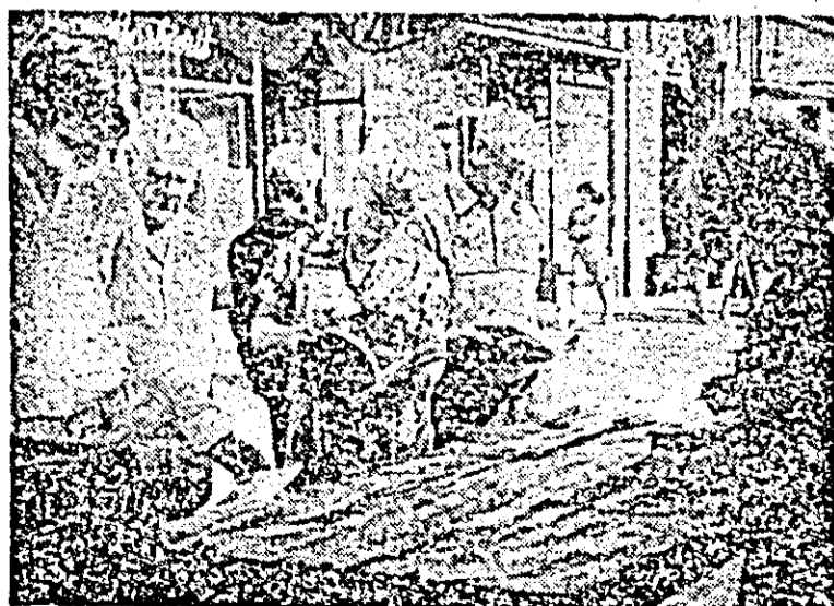
„Imagine caracteristică a interesului mereu prezent pentru carte, dincolo de anotimp și dincolo de vîrstă.”