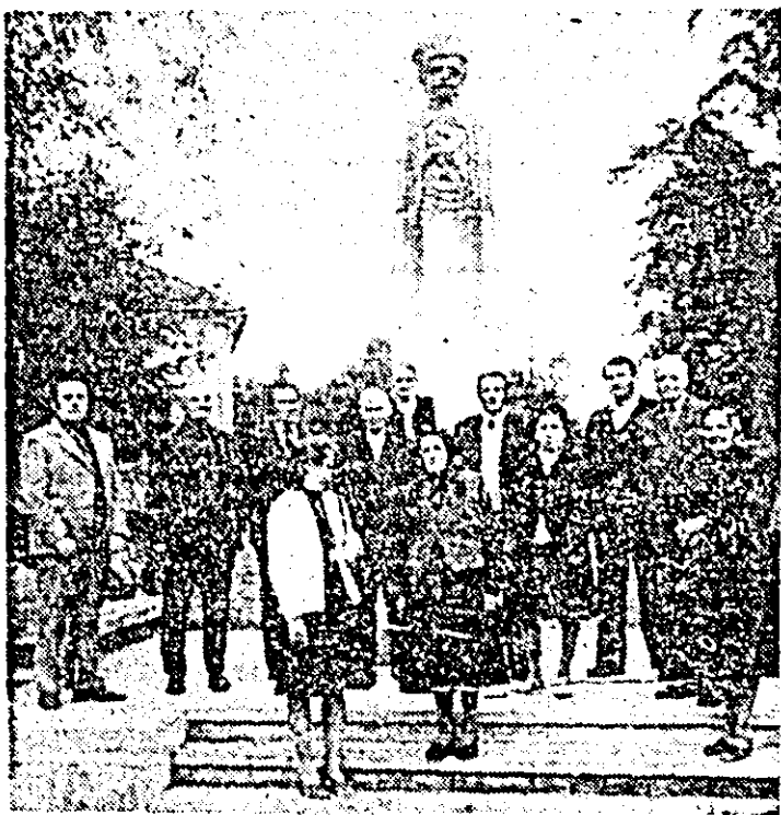
Membrii cenaclului „Lamura” al poezilor țărani din județul Arad în fața monumentului Avram Iancu din Hălmașiu.