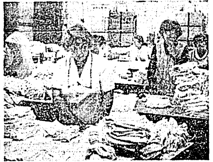
Întreprinderea „Tricolorul roșu”. Aspect din atelierul, unde se efectuează controlul final al produselor.

ză într-o producție fizică peste prevederile de 5000 bucăți figurine, destinate beneficiarilor externi, iar pentru fondul pietii au fost produse 10000 păpuși în plus. În felul acesta, producția pentru export a lunii iunie a fost realizată în avans, fiind executată, înaintea ultimei decade, 90 la sută din graficul de programare.