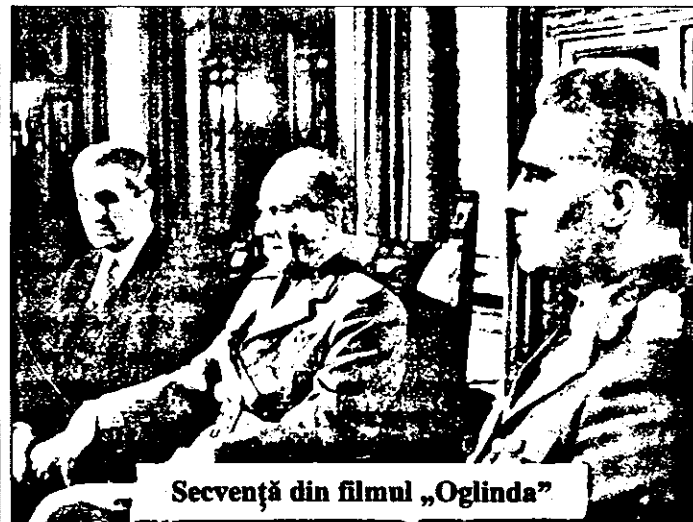
Secvență din filmul „Oglinda”

Începutul adevărului - Oglinda , producția Star Film, în colaborare cu Româniafilm și