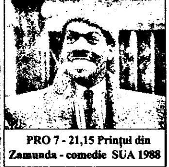
PRO 7 - 21,15 Prințul din Zamunda - comedie SUA 1988

16,25 Meteo 16,30 Telesport: CM de aerobic, J.O. de iarnă 19,07 Noul Lassie - s. amer.: Spargerea