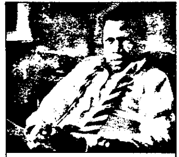
RTL 2 - 0,55 Fără scăpare - f. SUA 1969

12,20 Tânăr și fără odihnă - s. amer.: Doi rivali 13,15 Roata norocului 14,00 Vaporul iubirii - s. amer.: Lady și soferul