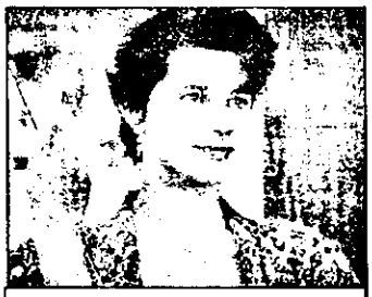
PRO 7 - 0,40 Musca 2 - f.fantastic SUA 1988

15,15 Teletext - prezentarea programului, meteo 15,25 Alpi - Dunăre - Adriatică