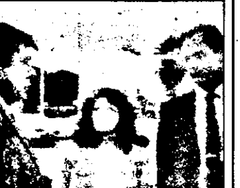
SAT 1 : 23,10 Hunter - Contract mortal - serial polițist SUA

9,00 Știri ITN 9,15 Magazin economic 9,30 Jurnal NBC 10,00 Super shop 13,00 Piața mondială - magazin economic 13,30 Financial Times - reportaje 14,00 Azi - reportaje 14,20 Piața europeană 15,30 Roata banilor - Wall Street Magazin 18,30 Bursele europene 19,00 Azi - magazin informativ 20,00 Știri ITN 20,30 Magazin cultural euro- pean 21,00 Documentare 22,00 Cronica catastrofelor 22,30 Amintiri 23,00 Știri ITN