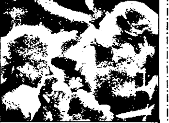
PRO 7 : 23,05 Acuzatul - film SUA 1988

7,45 Magazinul satului 8,30 Desene animate 8,55 Mesajul Biblic 9,03 Unde, ce? - mag. informativ 9,30 Hallo, duminică! - mag. dis- tractiv 12,00 Shujbă evanghelică 13,00 Știri, teletext 13,05 Jurnal cultural: Copiii - lumina ochilor, Pediatrică, MIR, Fotografii - anii '30; Premii Nobel 1993 14,40 Muzică 15,10 Emisiune pentru mame 15,40 Magazin turistic 16,25 Cine-magazin 17,05 Emisiune de religie 17,30 Program Walt Disney - desene animate 18,35 Dallas - s. am. - Noua rudă 19,30 Roata norocului 20,00 Săptămâna - mag. informativ