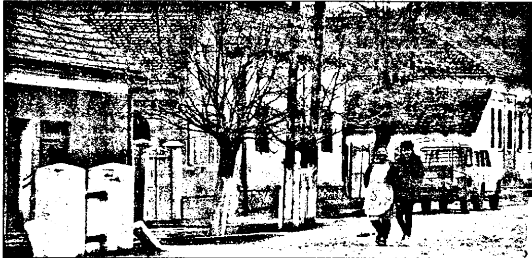
Șiștarovăț - o comună depopulată, o comună pe cale de dispariție.