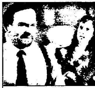
RTL - 21.15 Colombo - Câștig mortal - s. am.

7.00 Bună dimineața! - mag. matinal și sportiv 10.05 Alf - s. am. rel.