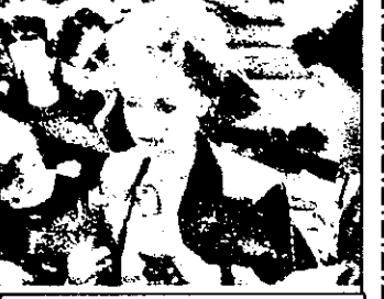
SAT 1 : 21,15 Supergirl - film acțiune SUA 1984

23,15 Jimmy Reardon - f. aventuri SUA, 1987 1,05 Omul care s-a numit Venetia - f. polițist Italia-Germania, cu Maurizio Merli 2,35 Superpolițistul - film reluare 4,25 Jimmy Reardon - f. reluare