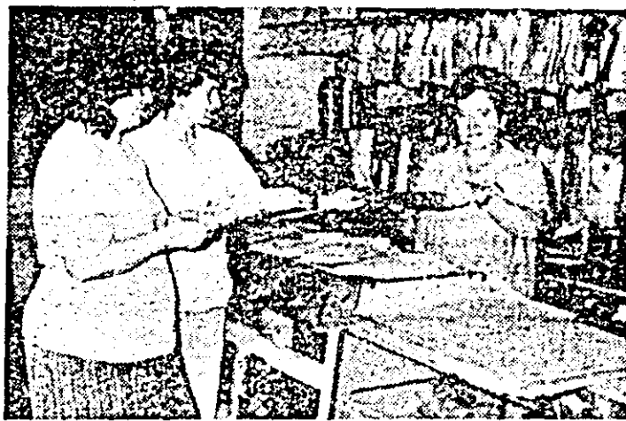
Secvență colidionă în raionul confecții al complexului comercial din Lipova

• La capătul străzii Dornei, un stîlp electric a fost scos din temelie și răsturnat pe acoperișul casei de alături. L-a distorsat o mașină în viteză. Se spune. Nu s-o fi găsit o altă mașină (cu o macar) să-l ridice urgent?