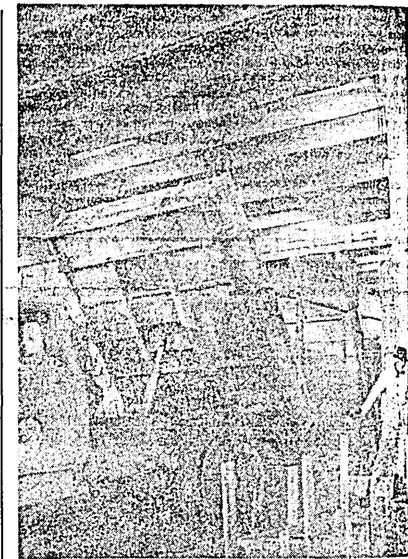
Pe șantierul Fabricii de feronerie Arad.

constituie echipe de oameni bine instruiți, care să fie permanent îndrumați de specialiștii agronomi și zootehniști, ale căror cunoștințe în domeniul folosirii pajștilor pot fi îmbogățite prin consultarea atenă a literaturii de specialitate, care oferă și multe alte detalii necuprinse în prezentele însemnări.