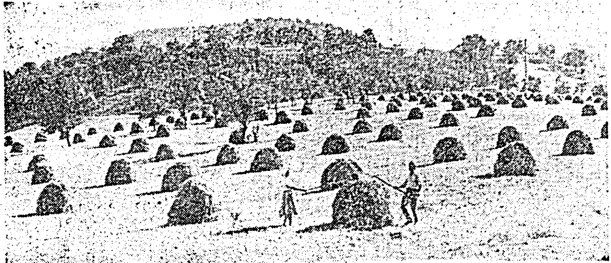
Stringera finului la cooperativa agricolă Joia Mare.

● În campionatul interjudețean la handbal