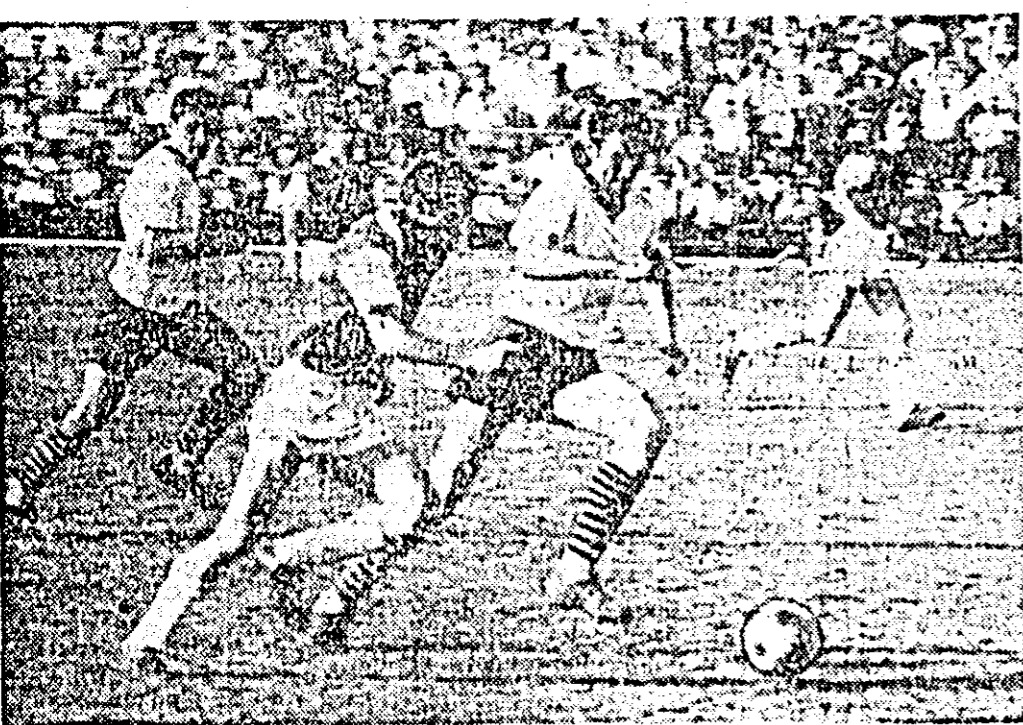
Fază din întâlnirea de fotbal U.T.A. — Jiul.