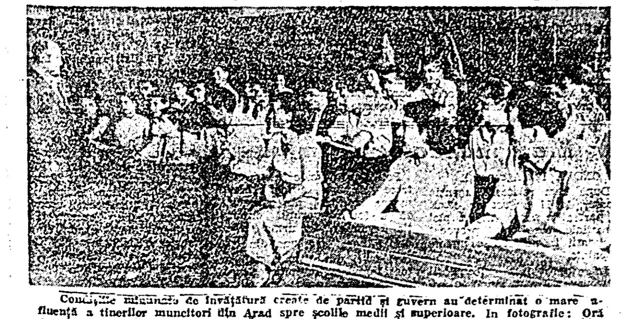
Condițiile deosebite de viață și muncă pe care le au tinerii din țara noastră sînt conștințiate în Constituția R. P. Romîne...