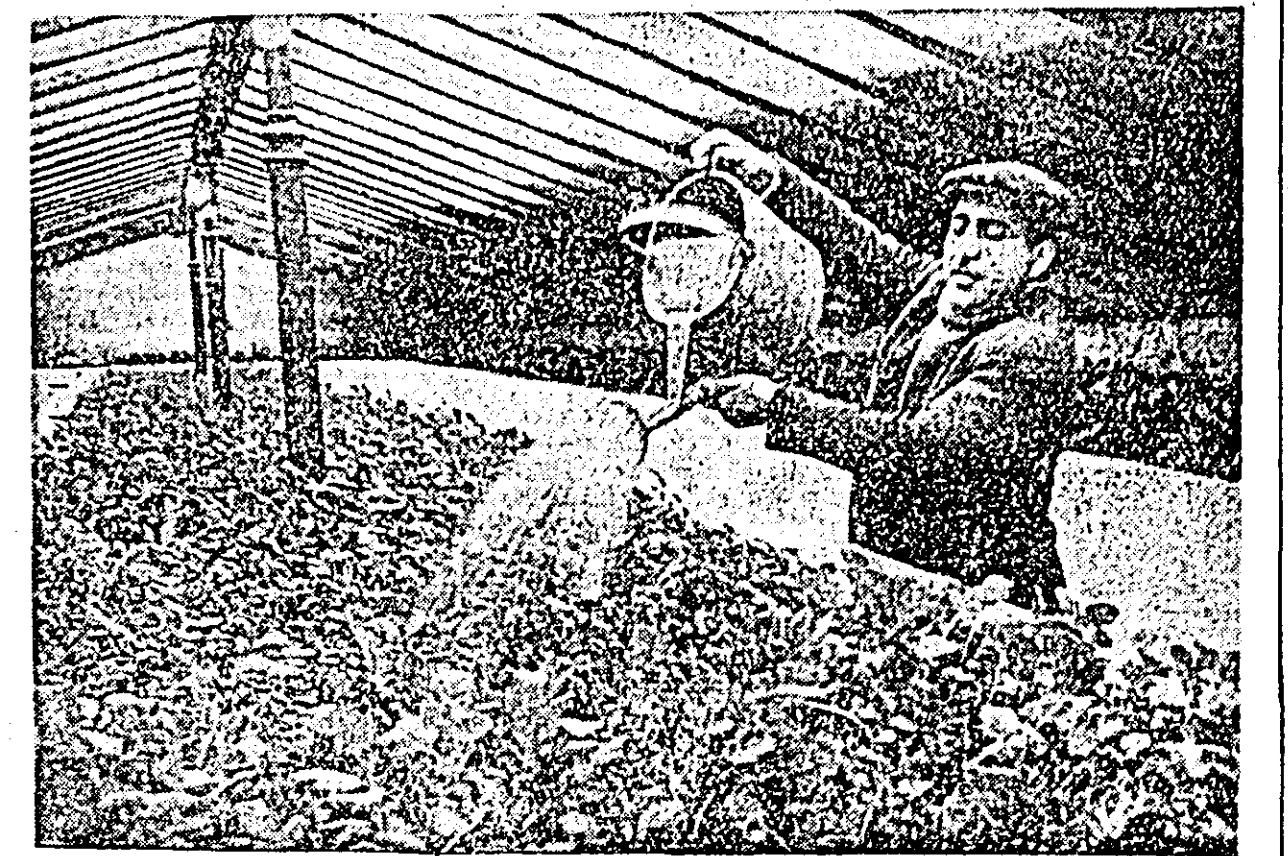
În timp ce administrează încă o doză de apă plantelor ce le cultivă.

să facă plățile. Banca cooperativă nu vrea. Mal mult. Trimitte o scrisoare pe adresa organului amintit și-l face cunoscut ca locuitorii din Fîrliteaz sînt meargă să-și ridice banii de la Vinga. Adică, vedeți dumneavoastră, de ce să se obosească un singur om 12 km cînd e mult mai rațional (slel) să se obosească 50 — 60 oameni. Ce părere aveți tovarășii conducători ai băncii cooperative agricole? Nu considerați că dilema poate fi rezolvată mai ușor și mai onorabil trimițîndu-vă emisarii la Fîrliteaz? (Dună o scrisoare a tov. SUSAN ROMULUS)