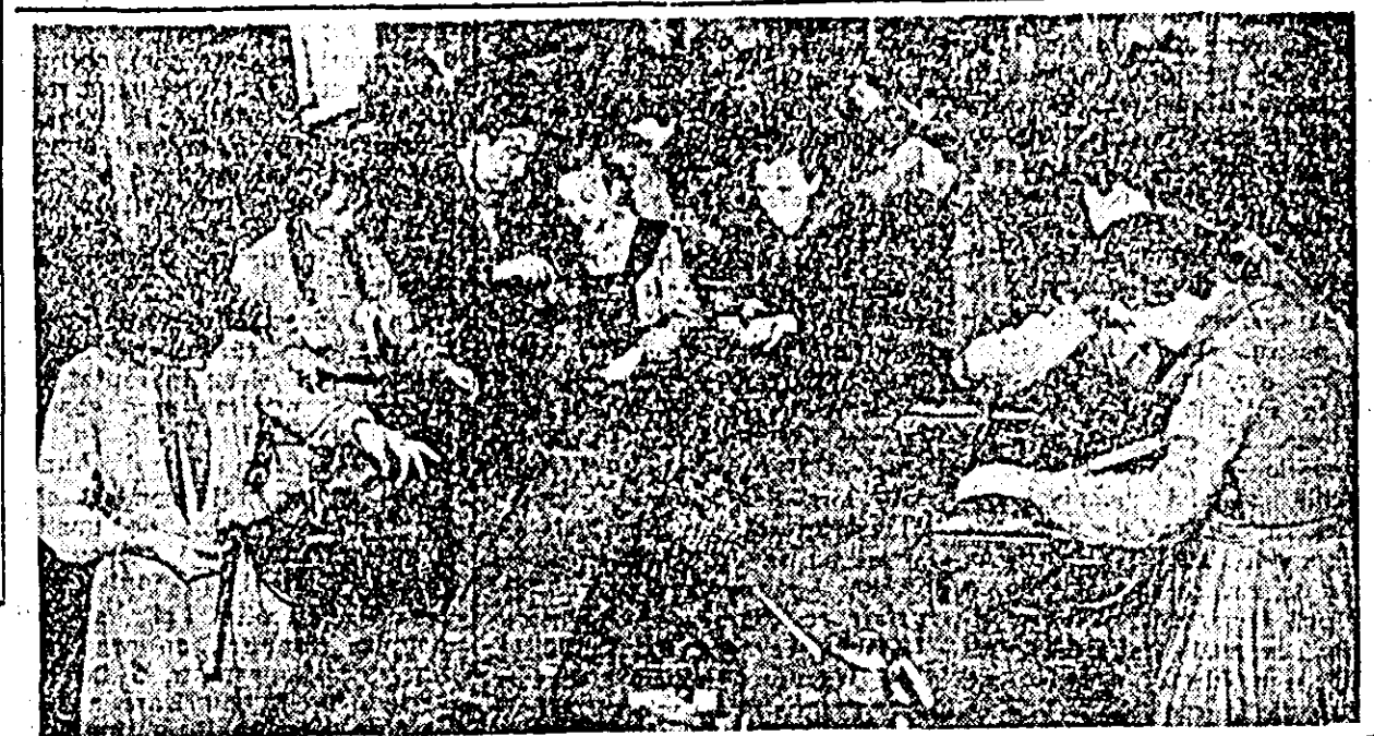
ÎN CLIȘEU: o parte din elevii Școlii medii nr. 6 din Arad Nou în timpul practicii la atelierele fabricii IPROFIL „Gh. Doja”.

Primi 10 câștigători vor face în vacanța de vară o excursie în Uniunea Sovietică. Dat fiind scopul educativ al acestui concurs, este bine ca profesorii, dirigînții, instructorii de pionieri să îndrume cît mai mulți copii să participe la el, sfătuiindu-l totodată să se străduiască pentru a da răspunsuri corecte și frumos exprimate.