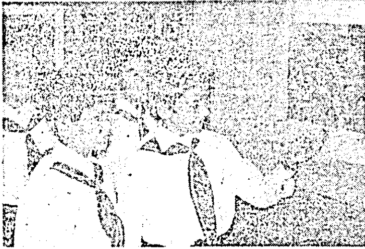
Aspect din expoziția de artă plastică deschisă la Casa pionierilor și soldaților patriei Arad sub genericul „România, plai de aur”.