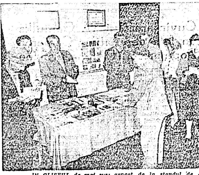
IN CLISEUL de mai sus: aspect de la standul de cărți

fului din localitate biblioteca a organizat un frumos stand de cărți, unde au fost expuse cele mai noi creații ale autorilor sovietici.