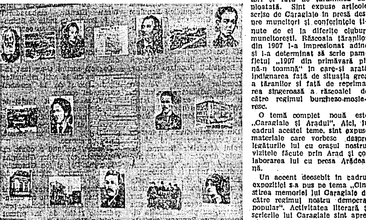
ÎN CLISBU: Un aspect de la expoziție

mocratia populară. Scrierile sale au fost tipărite după 23 August 1944 la noi în țară într-un tiraj de 1.200.000 exemplare.