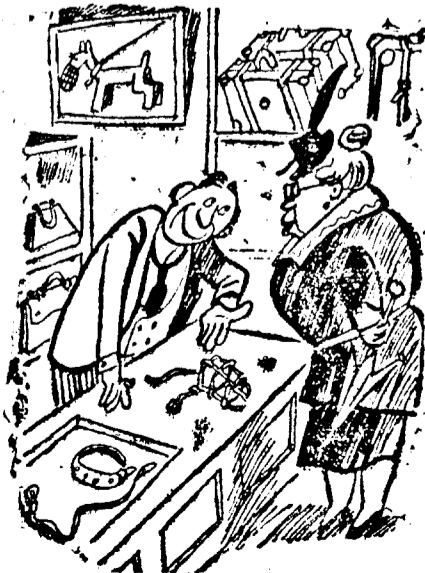
Beccomagórtam, asszonyom, vagy azonal használni méltóztatik?

ZÜRICH TŐZSDEZARLAT: Paris 11,80 és fél, London 20,86, Newyork 445,75, Brüsszel 74,90, Milánó 23,45, Amszterdam 236,65, Berlin 178,65, Száfia 504, Varsó 84, Belgrád 10,00, Bucaresti 325.