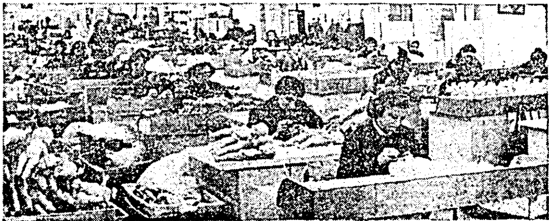
I.I.S. „Arădeanca”. Secvență de muncă în atelierul de pictat.

ORGAN AL COMITETULUI JUDEȚEAN ARAD AL PARTIDULUI COMUNIST ROMÂN ȘI AL CONSILIULUI POPULAR JUDEȚEAN