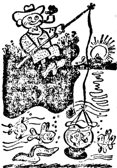
az állatvédelmi egyesület díszelőke?