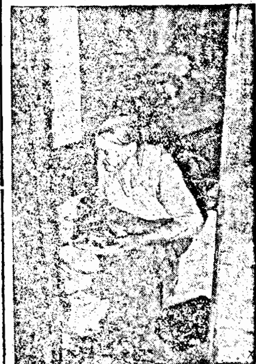
O nenorocită din paradisul sovietic.

Aviația britanică a pierdut în ziua de 29 și în noaptea de 29 spre 30 Septembrie 11 avioane de bombardament.