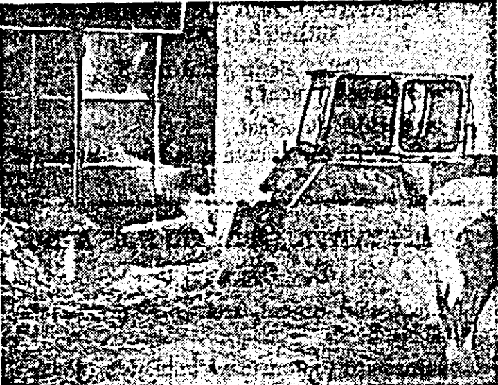
Prin ușa insuficient de etanșă, zăpada spulberată de vînt se strecoară chiar și într-un adăpost modernizat de la C.A.P. „23 August” Curtici.

La ferma zootehnică a C.A.P. Macea funcționează o instalație de producere a „lactosilului” — un produs furajer valoros, ni s-a spus. Iar pri-