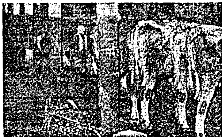
Tot la C.A.P. „23 August”, igiena corporală a animalelor e în mare suferință, iar în adăpost murdăria e la ea acasă.