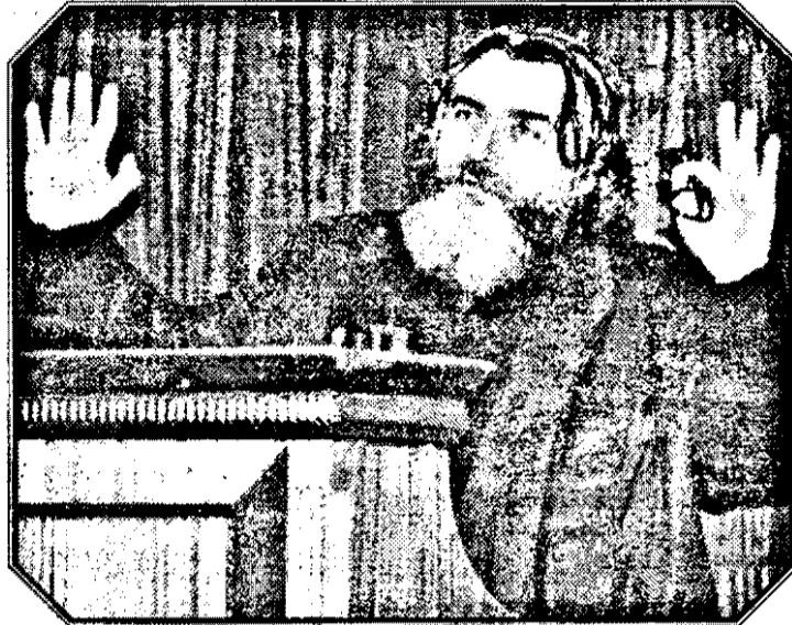
În pagina 7: Un amplu interviu cu senatorul Adrian Păunescu

În pagina 12 Dorin Suciu semnează o interesantă corespondență din Budapesta