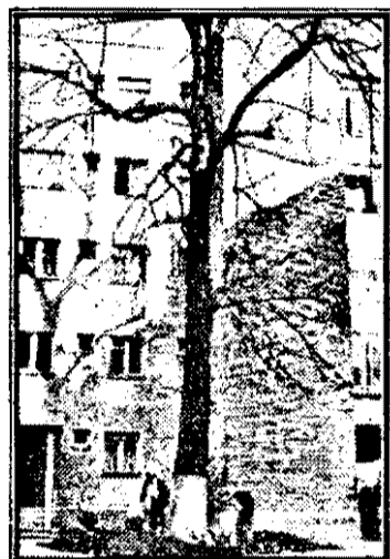
dea în schimbul copacului doi pnieți!”

Pe strada Horia la numărul 4 s-a iscat un adevărat „război” din pricina unui... copac. Este vorba de un tei sălbatic, de peste 100 ani, ce aparține domeniului public. De o parte a baricadei se află asociațiile de locatari ale blocurilor H9-H10, iar de cealaltă parte asociația de locatari de pe strada Horia nr. 4 „Corpul” A. Motivul? Tăierea sau nu a copacului din imagine. Asociațiile de locatari H9 și H10 susțin tăierea teiului pe motiv că este uscat în proporție de 75 la sută, fiind un pericol public atât pentru autoturismele parcate în apropiere cât și pentru copiii ce se joacă în preajma blocului deoarece la cea mai mică adiere a vântului cad crengi uscate. Cealaltă parte, locatarii ce nu susțin tăierea copacului, împiedică acest lucru, justificat din punct de vedere ecologic, deoarece este singurul copac rămas în acea parte a curții interioare. În urma discuțiilor în contradictoriu, s-a deplasat la fața locului chiar și d-nul primar Moisesuc care „a promis să ne