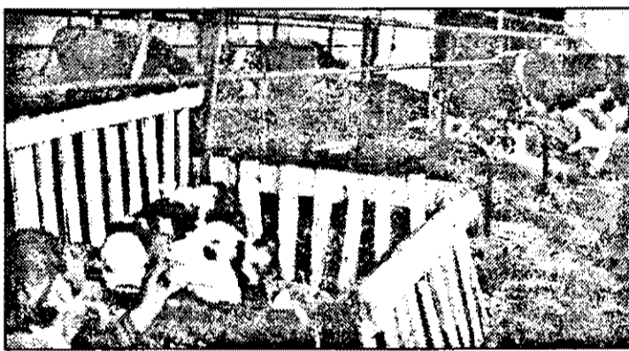
SCIL Arad a urmat îndeaproape evoluția zootehnică - mai puține animale, mai puțin lapte...