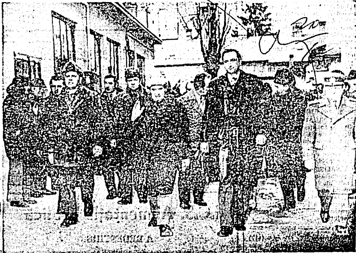
Spre nolle secții ale întreprinderii „Victoria”

Puternic mobilizați de indicațiile și recomandările secretarului general al partidului, de îndemnul ce le este adresat și cu acest prilej de a munci mai bine, mai spornic, mai eficient, ei s-au angajat să acționeze cu exigență și răspundere, cu spirit revoluționar și novator pentru îndeplinirea obiectivelor propuse, a sarcinilor ce le revin din programul elaborat de Congresul al XI-lea al P.C.R. de furtire a societății socialiste multilateral dezvoltate și înaintare a României spre comunism.