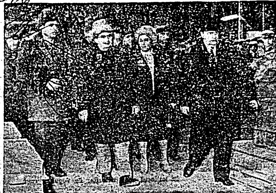
Prin secțiile întreprinderii de strunguri (dreapta)