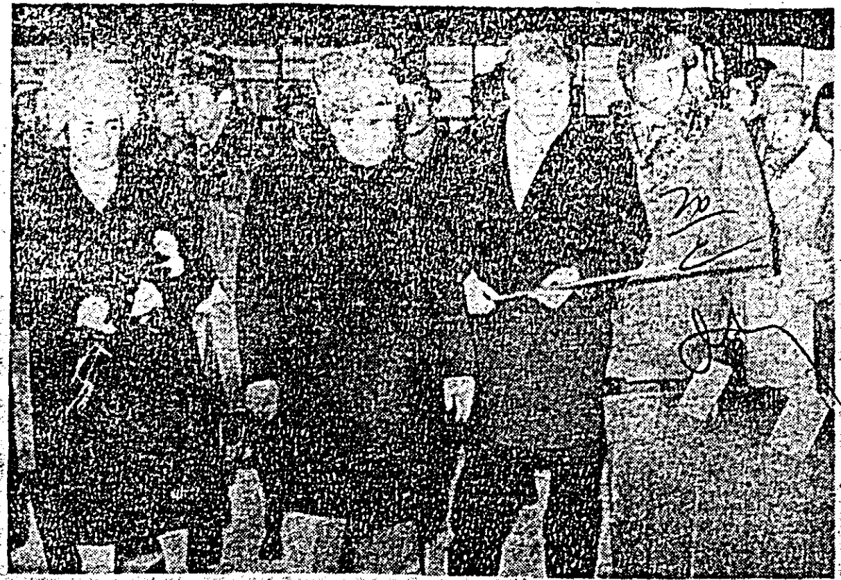
În mijlocul constructorilor de vagoane