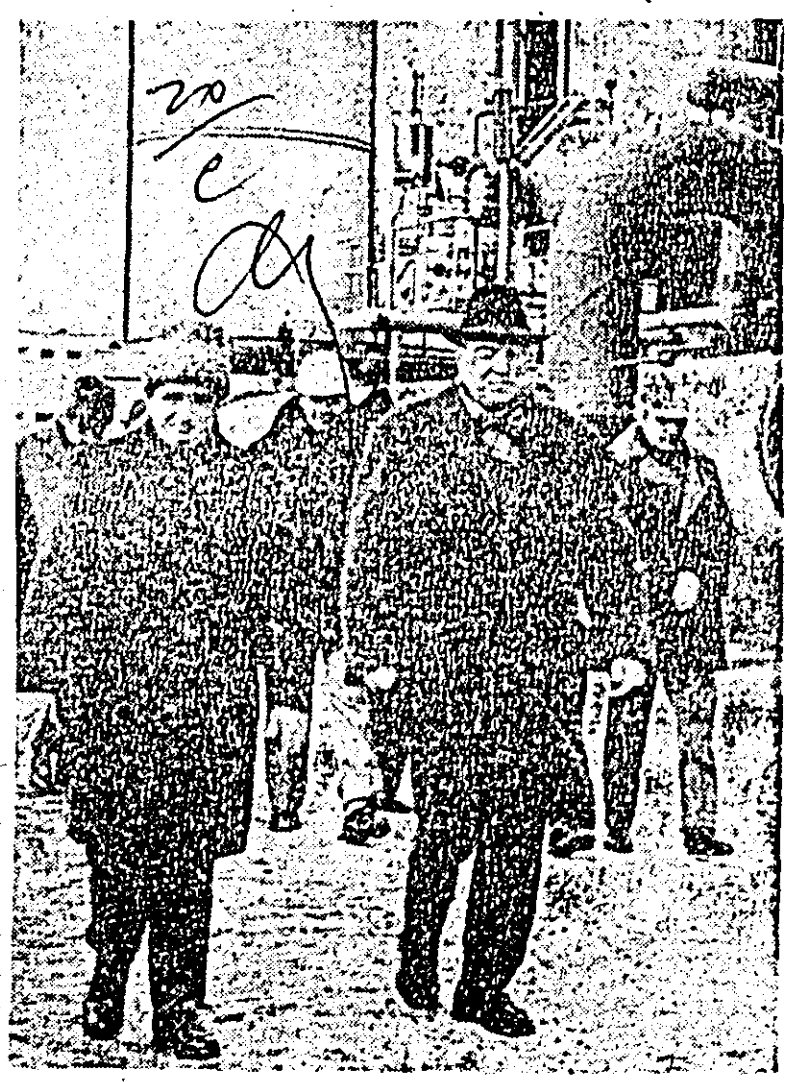
Pe platforma Combinatului chimic

Tovarășul Nicolae Ceaușescu a examinat apoi probleme privind dezvoltarea în perspectivă a uzinei. Gazdele au menționat că în