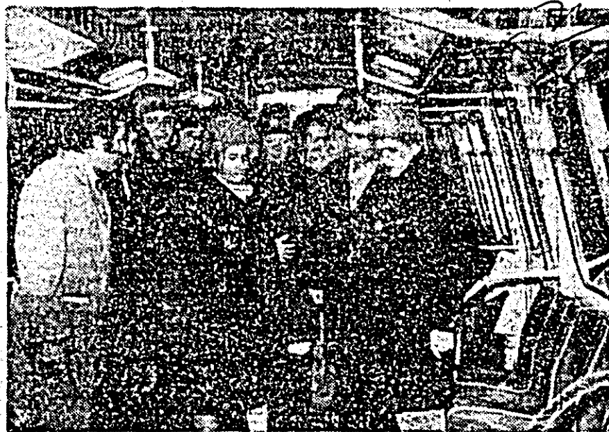
În vagonul pentru metrou (stînga)