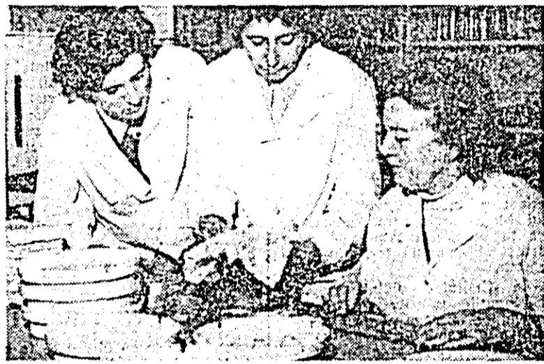
Soarta producției agricole depinde în cea mai mare măsură de calitatea semințelor ce se pun în pămînt. Iată de ce, la Inspectoratul județean pentru calitatea semințelor și materialului săditor, analizele de laborator se execută cu minuțiozitate și răspundere. ÎN CLIȘEU: se determină starea de germinație a semințelor destinate culturilor de primăvară.

peste 40 hectare teren, unitățile au folosit mal bine îngrășămintele naturale și chimice. Lucrările agricole au fost bine executate, iar cooperatorii au o participare continuă la lucru. Ca urmare, anul trecut, la cultura cerealelor păioase, bunăoară, a fost obținută o producție de peste 15000 tone, cu peste 3000 tone mal mult decît s-a prevăzut, la