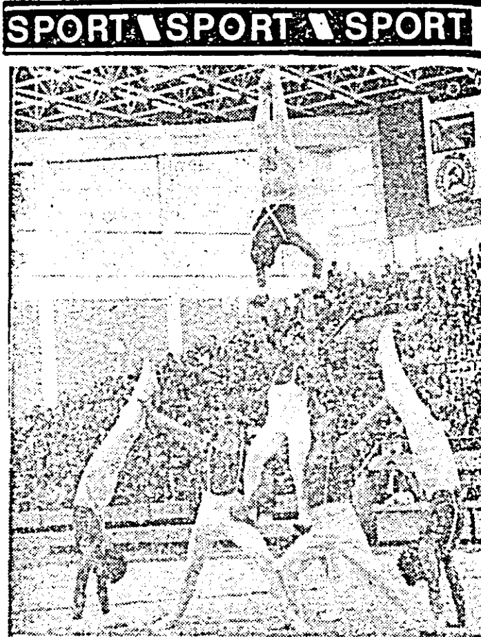
O reușită piramidă sportivă executată de gimnastii de la Asociația sportivă Rapid, cu ocazia inaugurării frumoasei săli de sport polivalente.