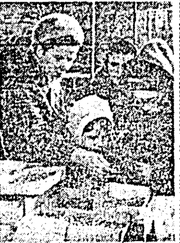
Mărțișoare pentru mămica, pentru bunica, pentru toți cei dragi...