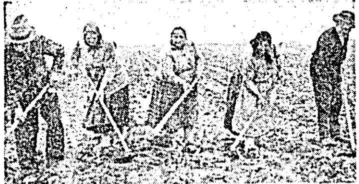
În orice clipă cînd pot intra pe teren, cooperatorii din satul Caporal Alexa acționează la prășit.

Socodor se deosebesc în privința stadiului lucrărilor de îngrijire la principalele culturi. Că se poate face mai mult ne-au dovedit-o unii cooperatori din Socodor care, zilele trecute, lucrau în condiții grele în grădina de legume pentru a elimina excesul de apă ce stagnează între rândurile de roșii și la legarea plantelor de araci, smulgînd buruienile din cultură. Se cere deci ca peste tot comandamentele agricole locale, conducătorii unităților, specialiștii să fie prezenți permanent în câmp, asigurînd cît mai repede încheierea lucrărilor de îngrijire a culturilor, sarcina de competență în aceste zile.