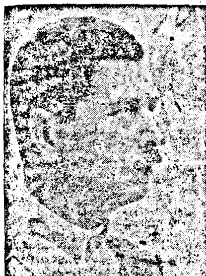
București, 14 (Sir). — În expresia acestui devotament pe care îl poartă

Suveranului său, capitala s'a gătit azi sărbătorește. Toate străzile au fost pavozate, magazinele au arborat steaguri, toate vitrinele au așezat portretele Regelui, înfățișându-l pe M.Sa. copil și principe moștenitor, fie alături de Augustul Său bunic, Regele Carol I, sau cu Regele Ferdinand, sau Regina Maria.