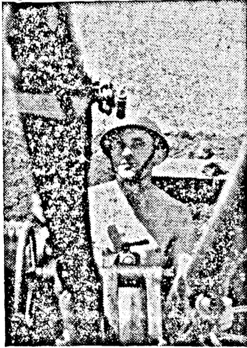
Ostașul român, apărătorul și desrobitorul Patriei, mândria Neamului și siguranța viitorului național.