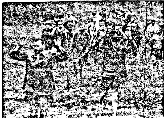
Soldajii bolșevici se pregăteau cu mîncare și apă pentru înaintări a trușelor aliate