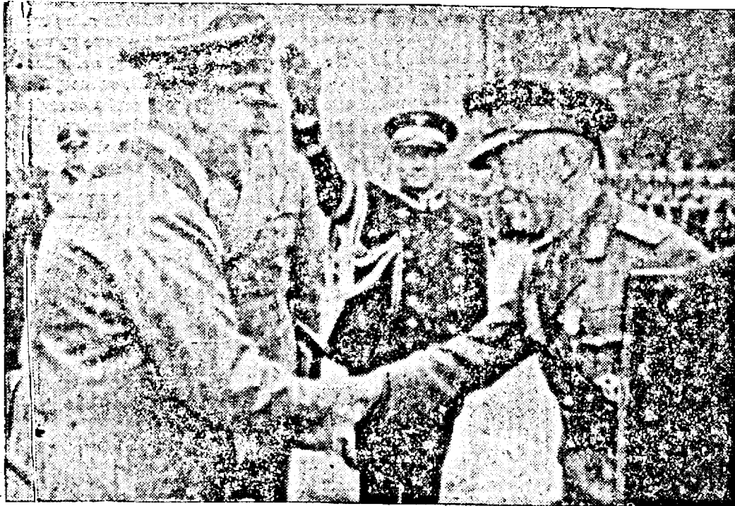
Führerul Adolf Hitler al Marelui Reich German strânge mâna Generalului Ion Antonescu Conducătorul marelui Popor Român, cu prilejul decorării.