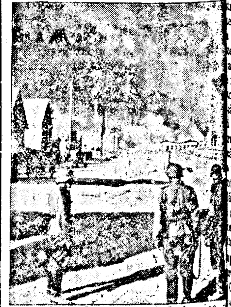
Urmele retragerii bolșevice

Abaterile vor fi constatate de organele poliției civile și militare.