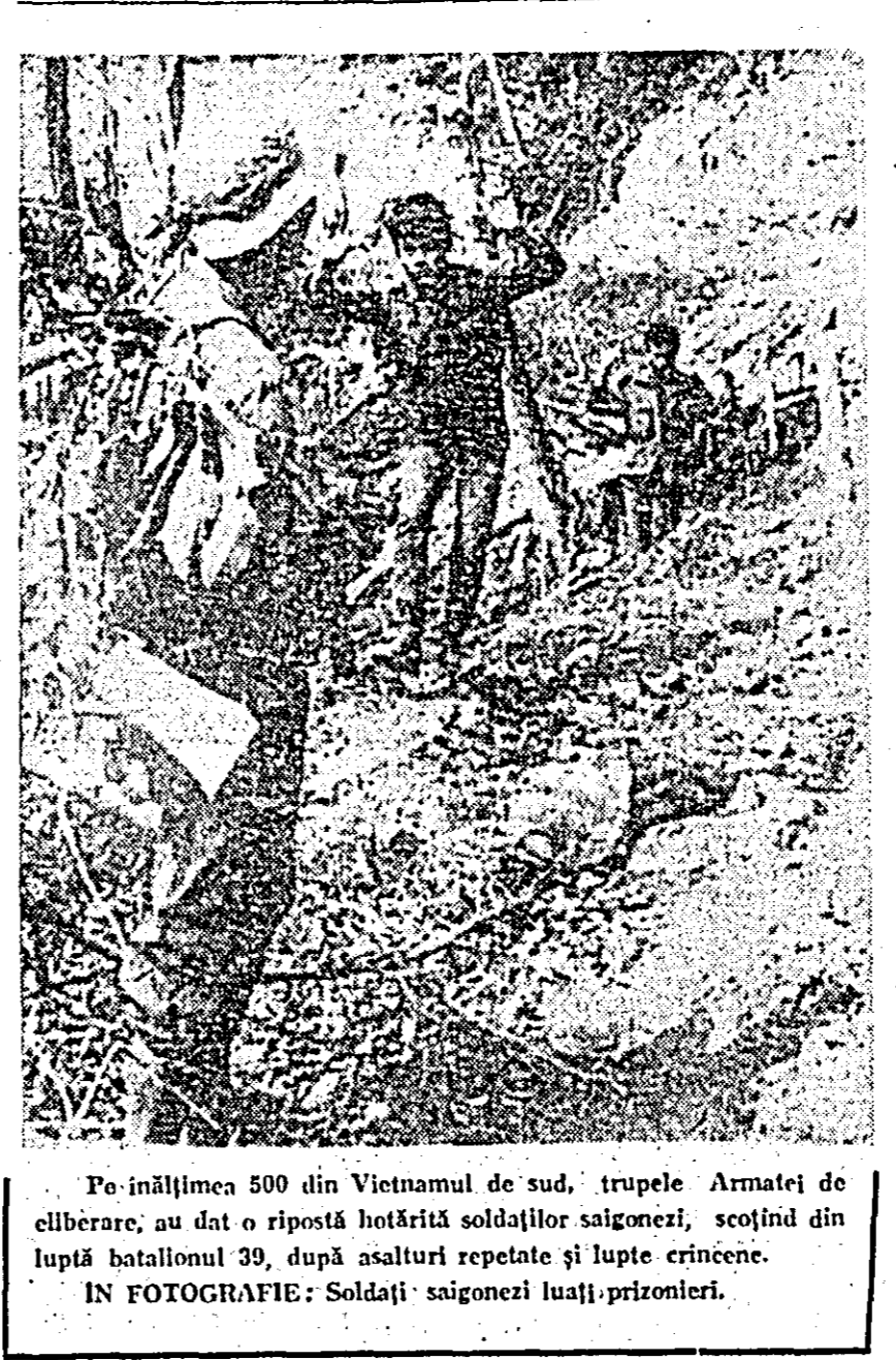
Pe înălțimea 500 din Vietnamul de sud, trupele Armatei de eliberare, au dat o ripostă hotărîtă soldaților saigonezi, scoțînd din luptă batalionul 39, după asalturi repetate și lupte crîncene.

sîmbătă o bază de artilerie americană situată la sud-vest de localitatea Plei Me, precum și instalațiile militare deținute de forțele saigoneze în orașul Duc Duc. În zona septentrională a Vietnamului de sud, o unitate militară americană a căzut într-o ambuscadă organizată de grupuri ale patrioților, la 20 kilometri sud de Quang Ngai.