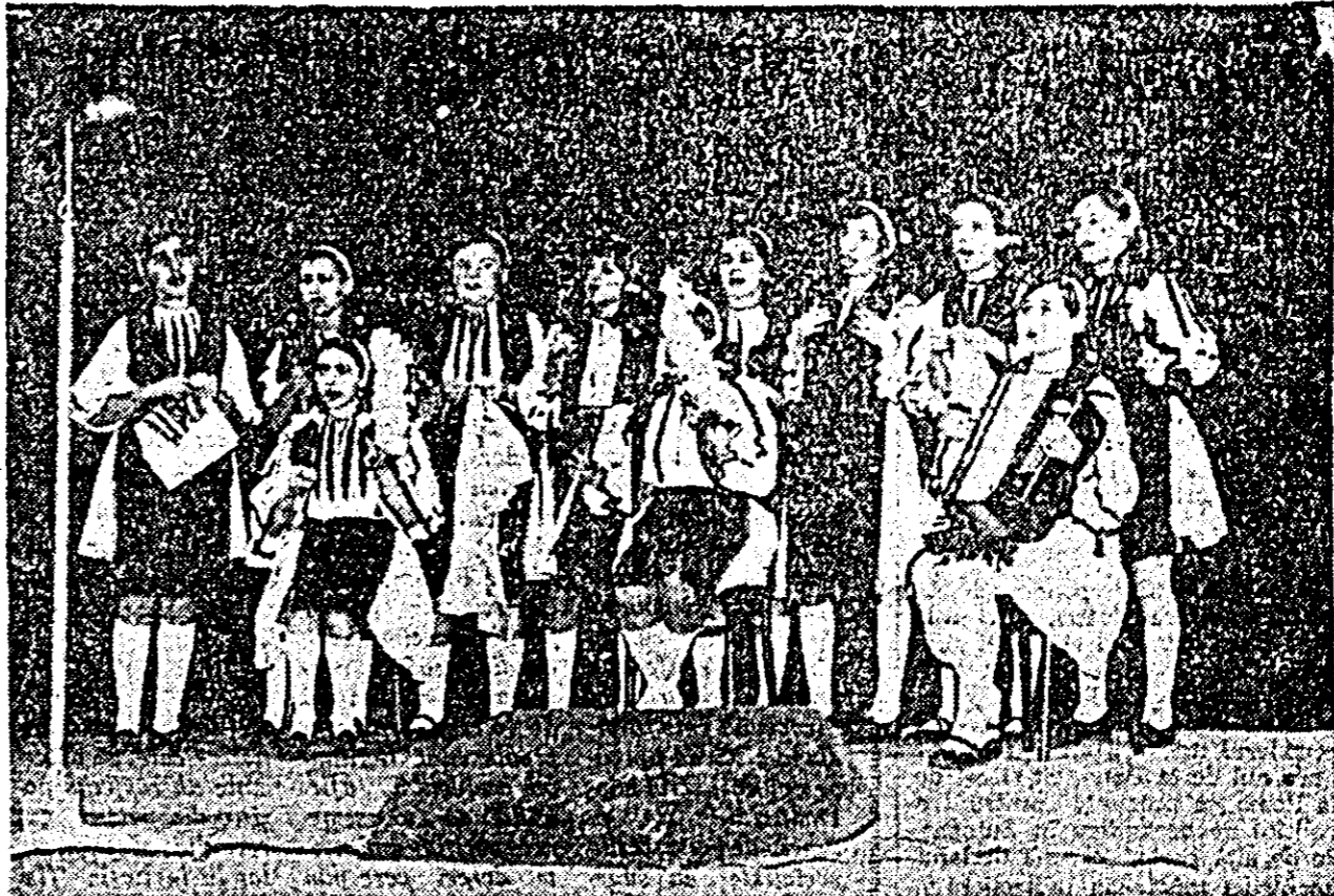
Grupul vocal al Școlii generale nr. 21 Sibiu.

Concluzia generală care se impune, așa cum am mai arătat, este că „Festivalul cultural-artistice al pionierilor și elevilor” a constituit o adevărată sărbătoare națională pionierescă care a impus nenumărați mini-artiști și formații pionieresti pe firmamentul mișcării artistice școlare de la noi din țară. Întreg festivalul a fost un emoționant și vibrant omagiu adus Partidului Comunist Român de cea mai tinăra generație. Încheiem printr-un cuvînt frumos și pentru organizatorii fazei republicane, zona Arad, Consiliului județean și municipal al Organizației pionierilor, care au avut grijă ca festivalul să se desfășoare în cele, mai bune condiții.