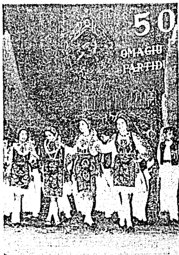
Grupul folcloric al Școlii generale Căpîlnăș (județul Arad)

chinat partidului. Dansurile populare ale Liceului din Ineu aduc în fața juriului și spectatorilor o infuzie de mișcare și ritm.