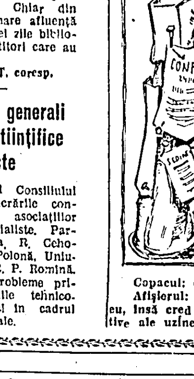
Copacul: care dintre noi o și așșierul? Așșierul: întrebarea asta mi-am pus-o și eu, însă ered că numai organele administrative ale uzinei ne-ar putea da răspunsul.