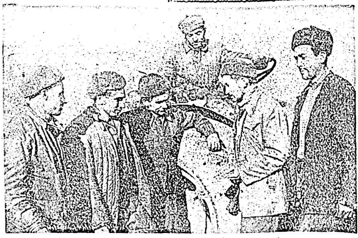
Pe ogoarele GAS Șiria