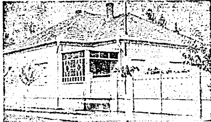
Una din noile case construite în ultimii ani la Sîntea Mare.

Costul unui abonament cu servire la locul de muncă este: 13 lei lunar, 39 lei pe 3 luni și 78 lei pe 6 luni. Abonamentul cu servire la domiciliu (în care este inclusă și taxa poștală de distribuire) este de 19,50 lei lunar, 58,50 lei pe 3 luni și 117 lei pe 6 luni.