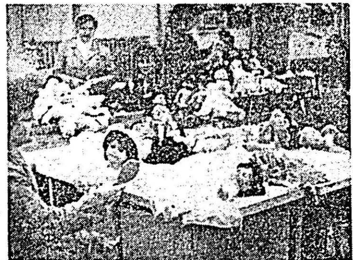
Întreprinderea „Arădeanca”. Aspect de muncă în atelierul îmbrăcat, colectiv fruntaș în întrecerea socialistă.