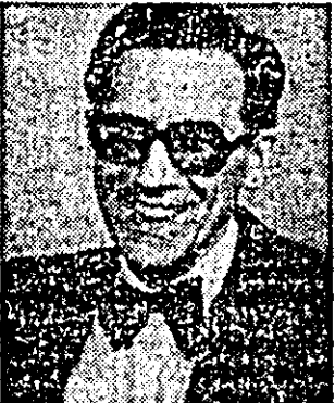
Interviul realizat de Lizica Mihut