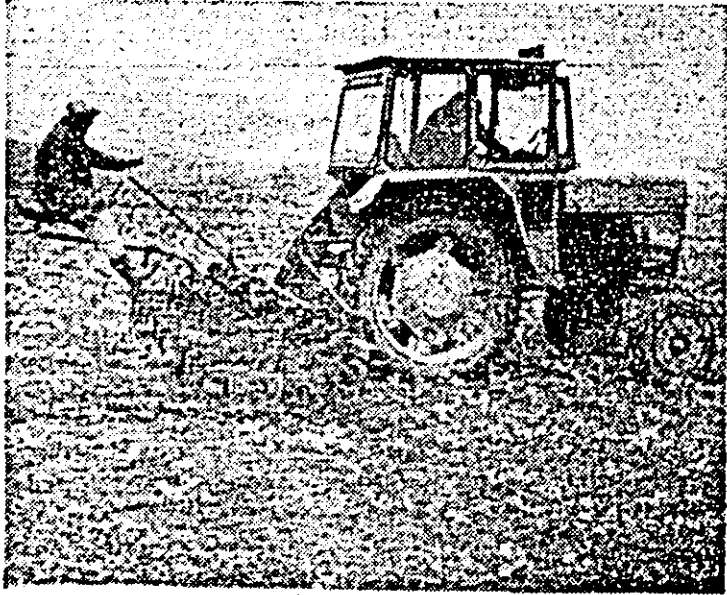
Pe terenurile fermei nr. 3 a C.A.P. „Avintul” Pecica se execută prășila a doua, mecanică, a sfelei de zahăr.

● Forțele de rezistență libaneze au atacat fortificații ale trupelor de ocupație israeliene în două localități din sudul țării, la Yater și Sarira. De asemenea, patrula și poziții ale Armatei Sudului Libanului (A.S.L.), creație a Israelului, au fost ținta atacurilor cu rachete trase de patrioții libanezi. Corespondenții din Liban semnalează că aceste acțiuni ale rezistenței s-au intensificat.