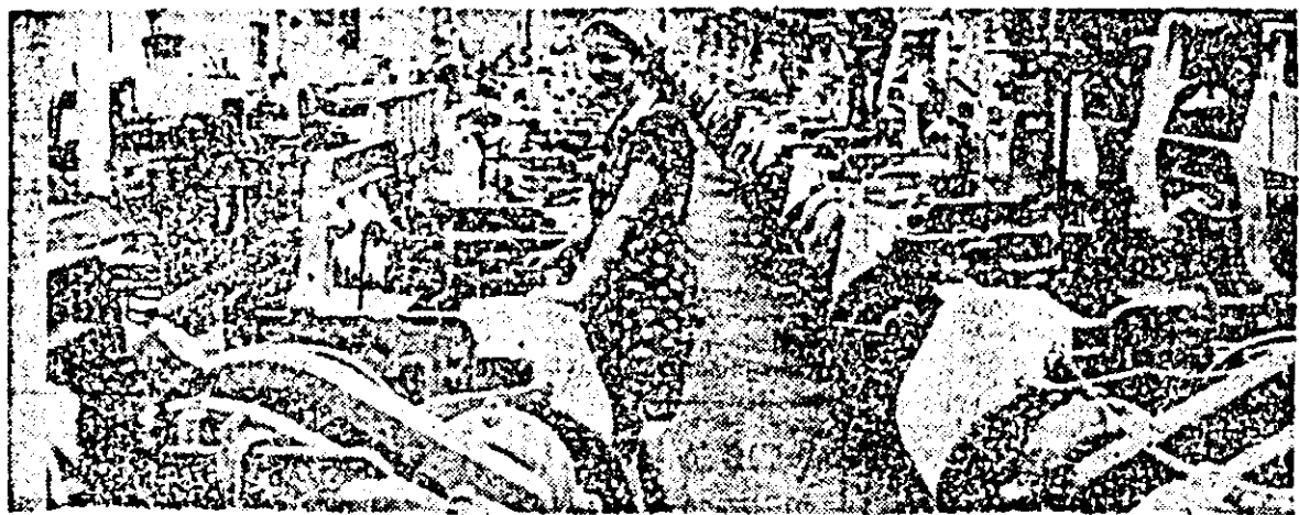
Încheind bilanțul celor opt luni expirate cu rezultate bune la o serie de indicatori, colectivul întreprinderii textile — de unde vă prezentăm acest instantaneu — adaugă în jurnalul întreprinderii socialiste noi realizări.