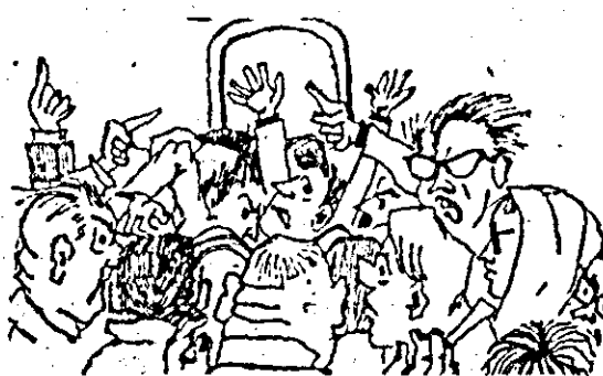
Atenție, vine controlul... cumpărați tichete!