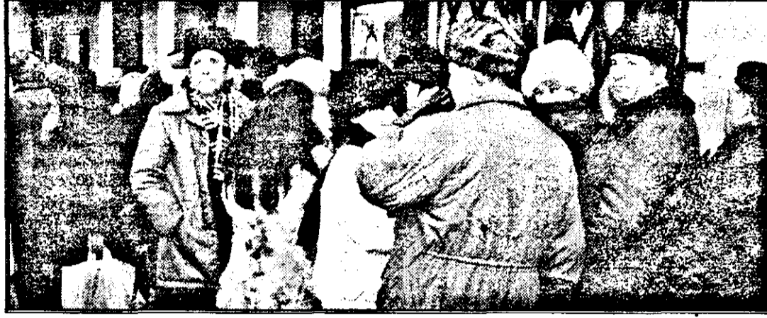
Coadă la...autosugestie

primitive, când vânătoarea și culesul a ceea ce a dat Dumnezeu reprezentau baza existenței omenirii. În lumea satului, adică locul unde se practică agricultura, a devenit, în timp, un spațiu deplin de a fi părăsit și, uneori, chiar disprețuit. Industrializarea capitalistă (și, la noi, socialistă) a mutat nu doar oameni, ci și obiceiuri, psihologii, tradiții, un întreg univers de la săt la oraș. Univers pervers de un spațiu nou, poluant și deformativ. Iar ceapurile au anihilat și bruma de țărani rămasă în uni-