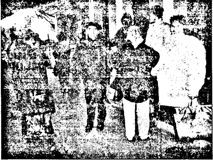
Ora 9.00: primii pacienți ai fenomenului Mudava sunt pe poziții, deși „consultațiile“ încep abia la ora 14.00.

pentru o persoană. În tot acest timp, vindecătorul miraculos își poziționează subiecții într-un anumit fel, după care-și plimbă palmele cu degetele deslăcuțe dea-