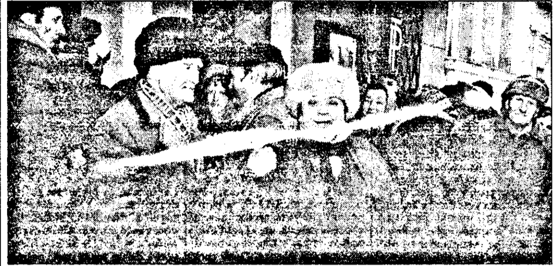
ORA 13.00: oamenii au început să amortească și să simtă furnicătură. Oare din cauza frigului sau pentru că Mudava este prin preajmă?!

cancer. De fapt, chestiunea se bazează în întregime pe autosugestie. O vreme, pe subiecții nu-i mai doare nimic, dar după ce pleacă Mudava din Arad, cu siguranță că durerile vor reveni.“ Dr. Ioan Stoiculescu - directorul Spitalului Matern: „N-am crezut că în Arad sunt atâtia naivi, ca să nu zic altfel. Oricum om cu mintea limpede ar trebui să-și dea