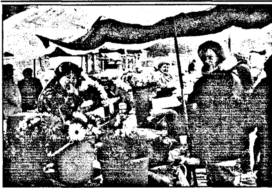
La 1500 - 1800 lei firul de garioasă, a oferi astăzi cuiva un buchet de flori a devenit un lux.