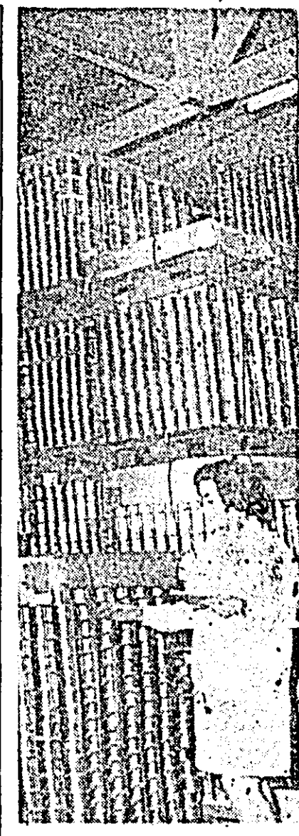
În depozitul fabricii „Reface-rea” tone de conserve de bună calitate stau pregătite pentru a lua drumul către beneficiari.

ple, cu randament mai sporit. Gândirea creatoare a acționat și în modul de organizare a unor lucruri de muncă, așezându-le pe criterii mai raționale, științifice. O asemenea reorganizare a atelierului de montaj al broaștelor îngropate, cu cilindri de siguranță, a redus timpul de staționare al benzii de montaj, a sporit viteza de lucru. Ni s-a adus ca argument și o cifră: măsurile aplicate au avut rezultatul sporirea productivității muncii cu un volum care echivalențază cu lucrul a 27 de muncitori. Până aici toate bune, Iată însă că inginerul Helmuth Czibula, șeful biroului programarea producției, ne-o