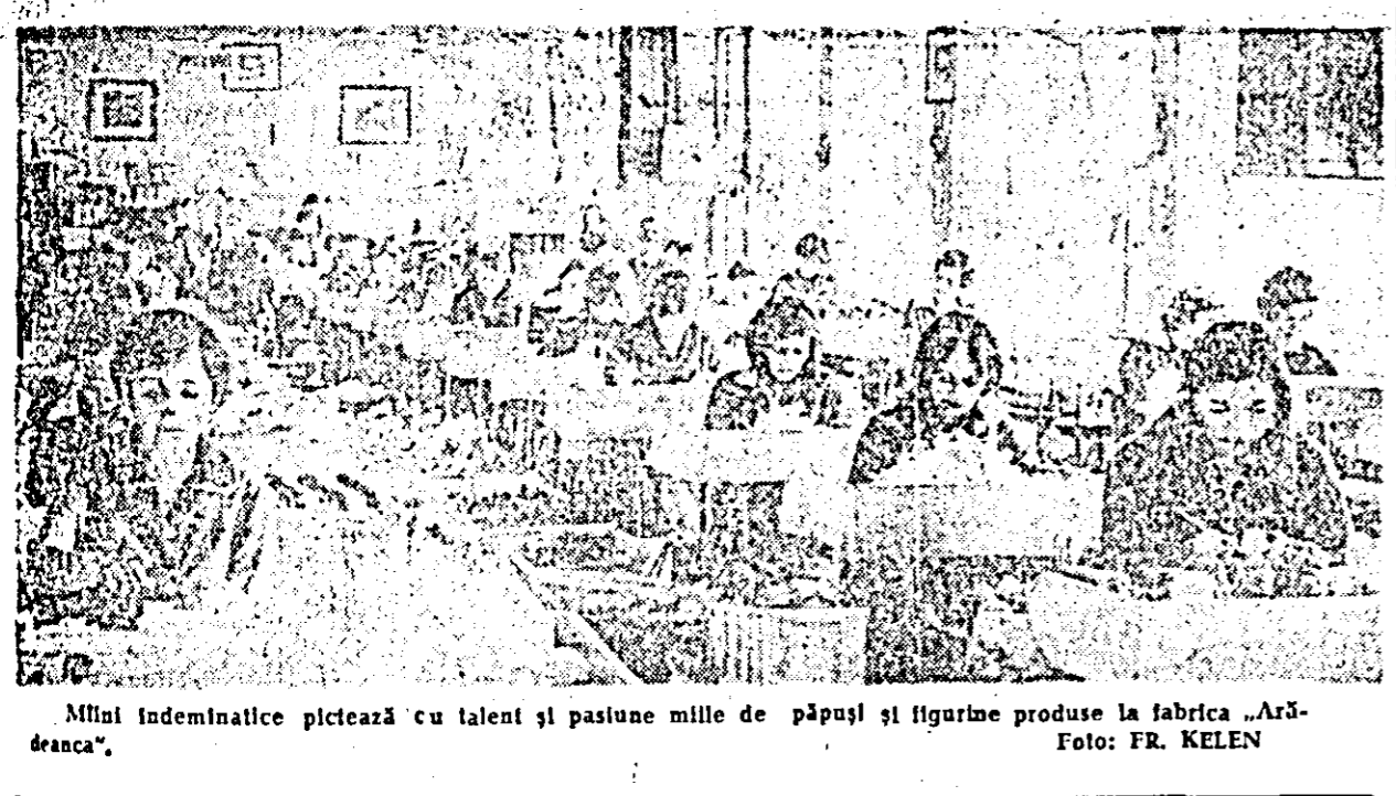
Milini îndemnatice pictează cu talent și pașune mîile de păpuși și figurine produse la fabrica „Ară-deanca”.

nist Român, Nicolae Ceaușescu, și primul secretar al Partidului Socialist Francez, Francois Mitterrand, dîndu-se o înaltă apreciere rezultatelor înregistrate în urma acestor convorbiri în promovarea bunelor raporturi dintre cele două țări. În această ordine de idei, s-a subliniat că vizita delegației de primari socialisti este o expresie a legăturilor dintre Partidul Comunist Român și Partidul Socialist Francez, convenindu-se asupra necesității dezvoltării în toate domeniile a dialogului statornic, pentru promovarea schimburilor și contactelor în folosul unei mai bune cunoașteri, a colaborării tot mai active dintre cele două țări. În timpul convorbirilor, au fost abordate, de asemenea, unele probleme actuale ale vieții internaționale. În încheierea înțînirilor, tovarășul Nicolae Ceaușescu a rugat pe oaspetele ca la înapoierea lor în țară să transmită saluturi și prietenesc primului secretar al Partidului Socialist Francez, Francois Mitterrand, precum și urări de succes primarilor membri ai Federației Naționale a deputaților municipali, cantonali și regionali socialisti și republican. Intrevăderea s-a desfășurat într-o atmosferă amicală, cordială.