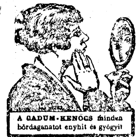
A CADUM-KENOCS minden bődaganatot enyhit és gyógyít

(Páris, október 29.) Berthelot tábornok az Echo de Parisban kiadott nyilatkozatát tesz közzé a francia hadsereg helyzetéről. Most fejezte be szemleutját és azt tapasztalta, hogy a hadsereget az önmagában való megsemmisülés veszélye fenyegeti. A tisztikar