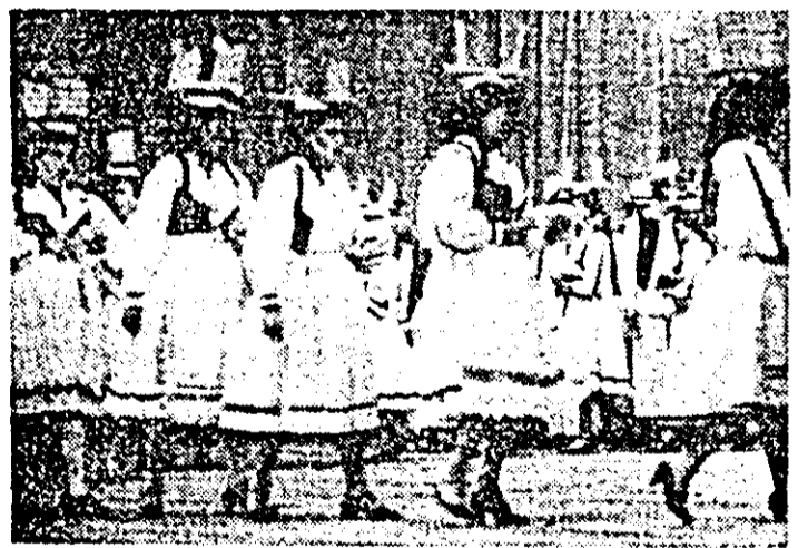
Obicei popular din Zimbru.