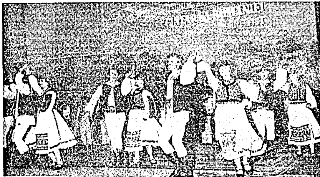
Formația de dansuri a Intreprinderii de vagoane Arad.