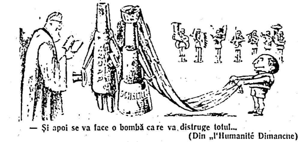
— Și apoi se va face o bombă care va distruge totul... (Din „Humanité Dimancne”)

În Germania occidentală, cu complicitatea cercurilor diplomatice occidentale, se refacă din nou industria de război. (Ziarele)