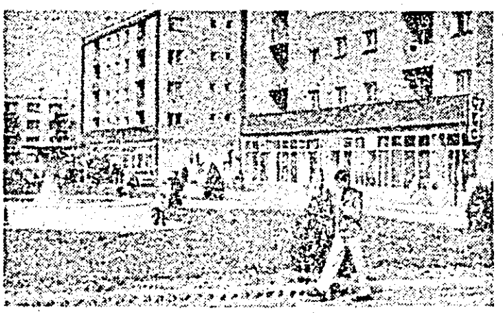
Veșere din Ineu.

— Eu o iau spre „Alimentara”, în spre „Încălțăminte” și pe urmă ne întîlnim îngă bradul ăsta!