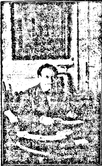
A világbajnok híres döntő-leosztása

amely nem trikkértékeket számít, hanem két pontra értékeli az ászot, ötre a királyt, háromra a dámát és egyre a bubot. Szanzaduid csak egészen erős lapra mondok be, ezért én a szanzaduidat szisztémámban erős szannak nevezem. Ehhez legalább huszonnyolc bécsi pont kell, tekintet nélkül az elosztásra és tekintet nélkül arra, hogy esetleg egy szinben teljesen síken vagyok. Mi normális szanzaduid egyáltalán nem licitálunk. Ha a partnernek semmije sincs, két treffel válaszol. Culbertsonnál a két treff indítás a legerősebb szemlem-invít, nálam: a leggyengébb válasz. Ha a partnernek négyes szine van akár pikkben, akár körben, akkor ezt bemozdítja, ha nincsen négy lapja e nemes szinek egyikében, azonban van annyi pontja, hogy segíthet, akkor a válasza: két szan. Culbertsonnál