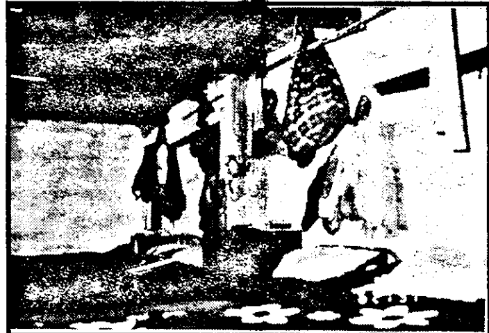
Casă pentru opt suflete necăjite. Lumina abia se prelinge în ea.

intuind parcă „de ce-ul”, pe care n-am apucat să-l spunem.