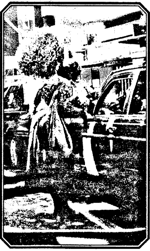
Cerșetorii rămân o problemă mereu la ordinea zilei. Pe când eradicarea acestor imagini, domnilor?