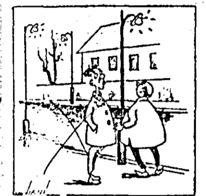
E un fel de compensație. Foată noaptea au fost stînsel