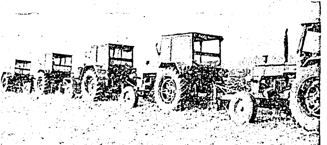
C.U.A.S.C. Chișineu Criș: forțe sporite acționează pentru urgentarea executării arăturilor de toamnă.