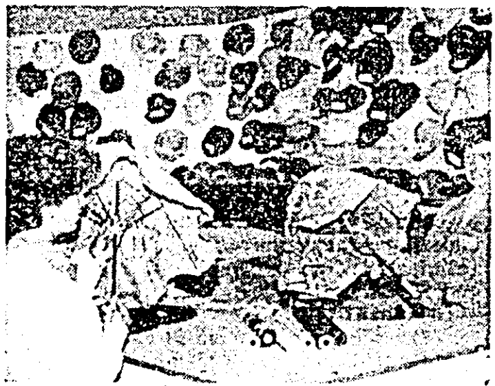
Aspect din ralonul galanterie femei al magazinului universal „Ziridava”.