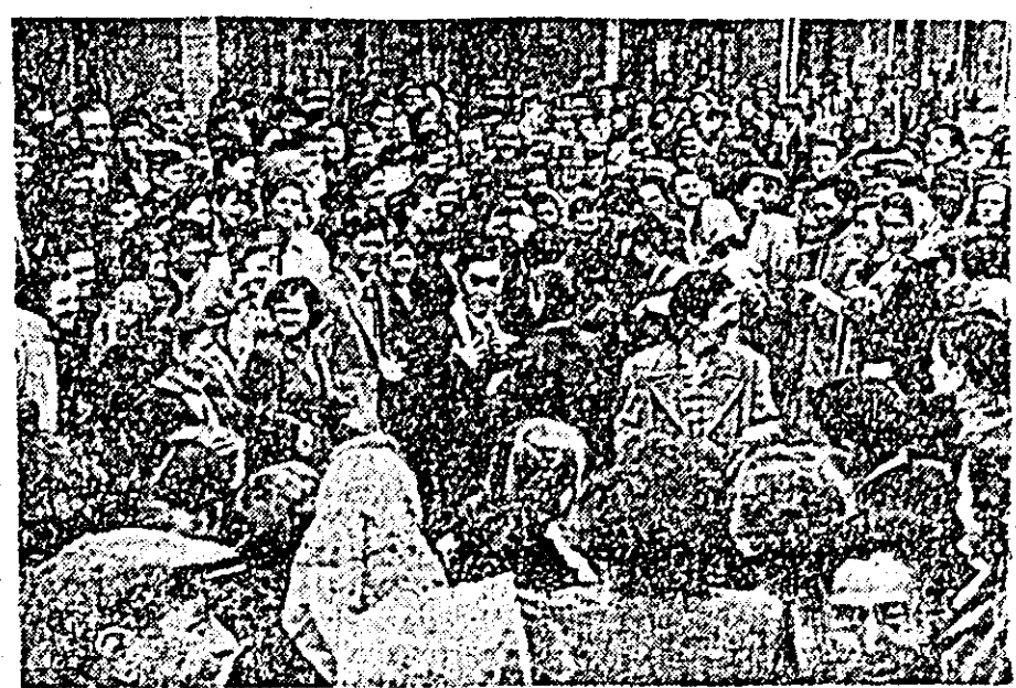
Fanfara uzinelor „30 Decembrie” a început să cînte tradiționalul joc românesc „Perința”. În scurt timp pe peronul gării s-a întins o horă mare la care au participat majoritatea membrilor Trupului de acrobați și numeroși tineri din orașul nostru.