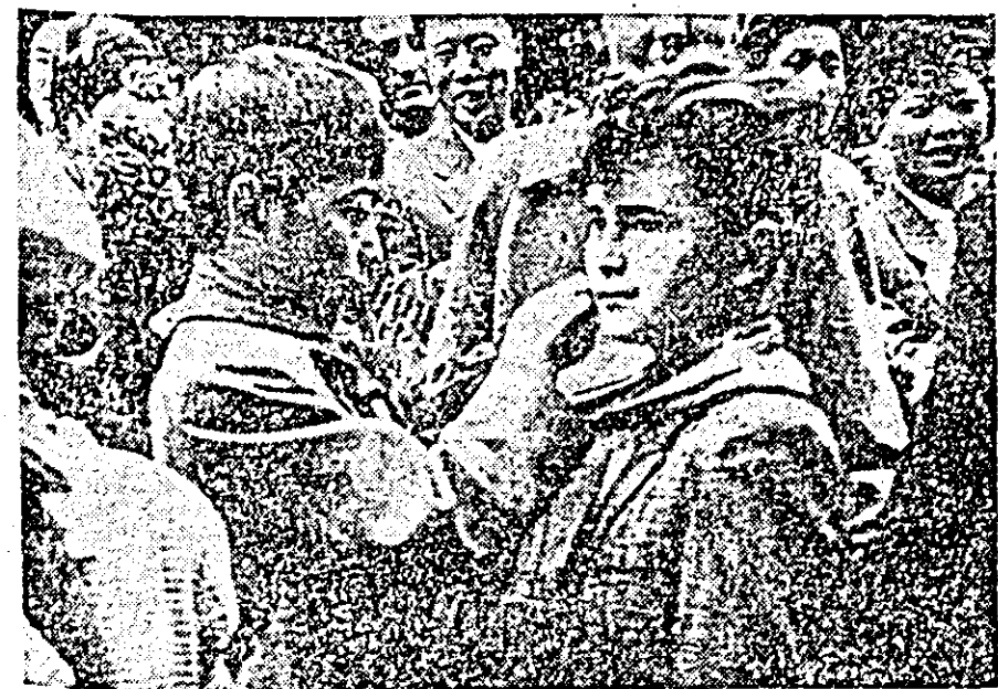
La primirea Trupului de acrobați chinezi în gara Arad, au participat numeroși pionieri. Aici, ei nu făcuseră cunoștință cu pionierii chinezi, membri ai Trupului de acrobați, făcînd schimb de cravate cu ei.

În cadrul expoziției care va fi deschisă pînă la 1 iunie, vor avea loc zilnic frumoase programe literare pentru elevi și pionieri, care vor fi alcătuite cu sprijinul secției de învățămînt și a comisiei de femei a sfatului popular orașenesc, a colectivului Palatului pionierilor, Teatrului de stat Arad și Lectoratului S.R.S.C.