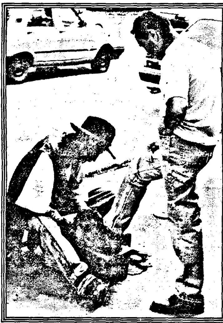
Încă un pas pe calea reformei Ciorbea. Au reapărut... lustragiile!

ticipate toate categoriile sociale nemulțumite de situația actuală. Se face apel, de asemenea, la organizațiile sindicale, partidele politice, asociațiile de pensionari etc. T.S.