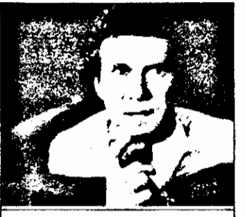
SAT 1: 21,15 Star Trek - Furia lui Khang - f.sf.SUA

6,30 Mag.matinal 9,30 Magazin economic 10,00 Superboy - rel.