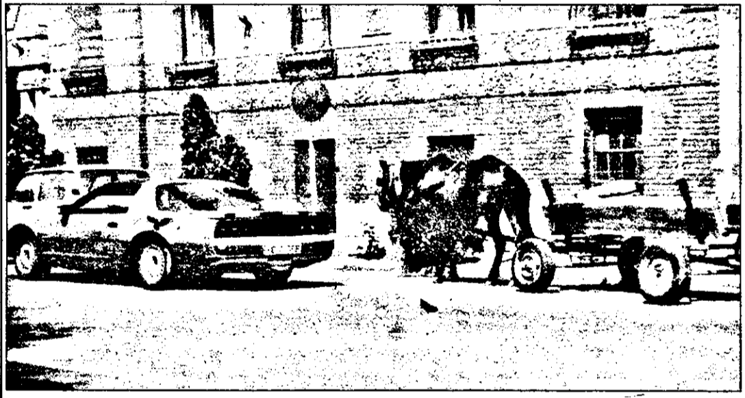
În parcare cu diverși...cai putere.