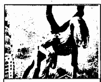
PRO7: 0,00 Q - f.fantastic SUA, 1982.

7,03 Prezentarea programului 7,05 Viața satului 7,25 Jurnal regional 7,35 Știri economice