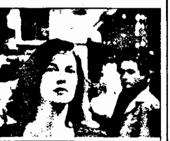
Budapesta 2: 22,05 Politistul nu renunță - f.Franța

9,00 Siri ITN 9,30 Jurnal european 10,00 Video-modă 10,30 X-Press