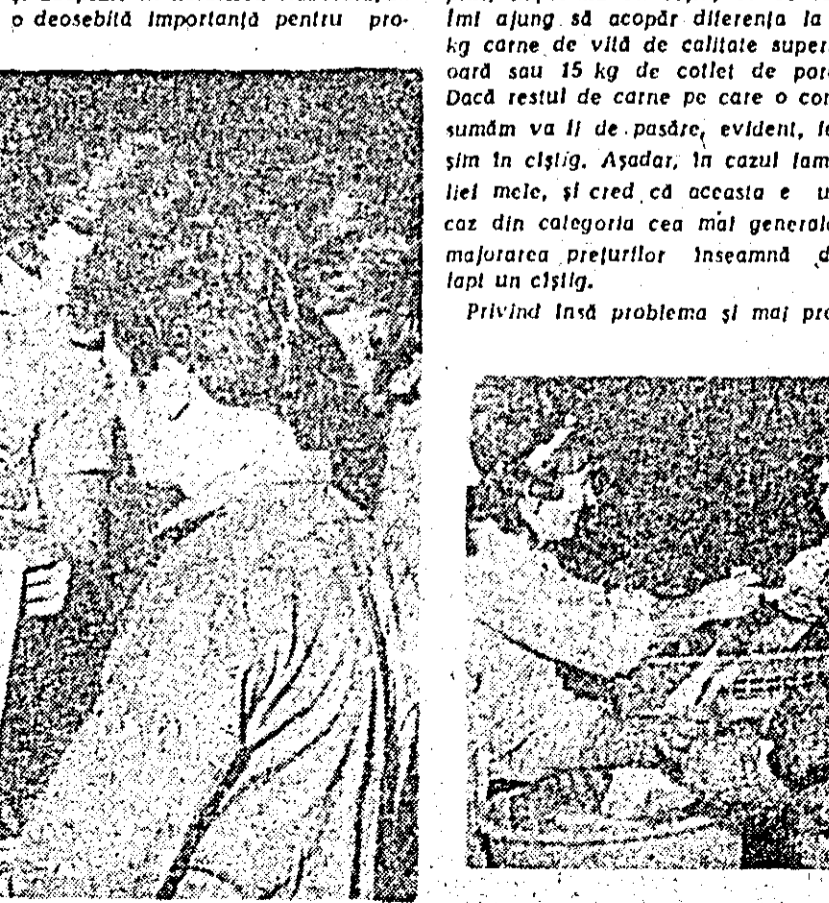
Simbolizând dimineața la magazinul alimentar „Central” ca de altfel în toate unitățile comerciale ale municipiului, s-a lucrat intens, cu noul număr al revistei.

Am urmărit cu atenție cuvântarea tovarășului Nicolae Ceaușescu la ședința comună a Comitetului Central al Partidului Comunist Român, a Consiliului Suprem al Dezvoltării Economice și Sociale și a Consiliului de Miniștri și m-am bucurat împreună cu toți cooperatorii din Horia de faptul că din nou în atenția partidului și statului nostru se situează creșterea și dezvoltarea în ritm mai intens a zootehniei — una din ramurile principale ale agriculturii.