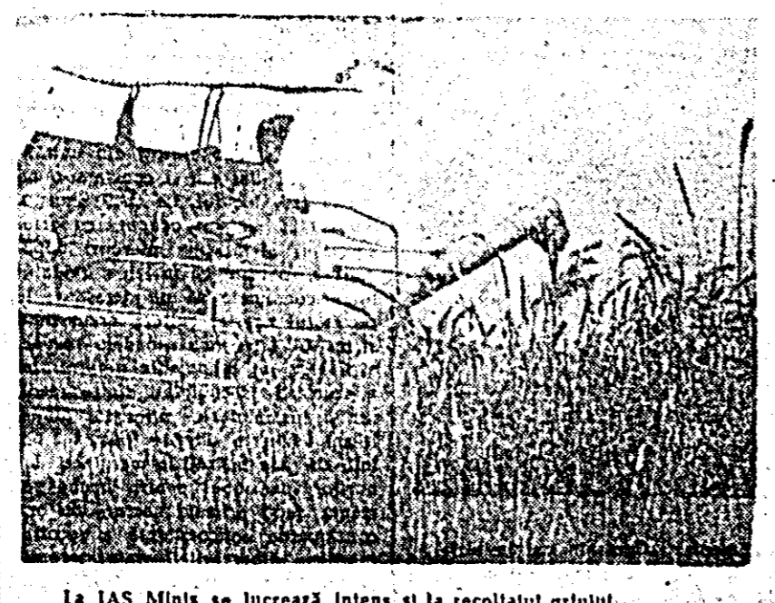
La IAS Miniș se lucrează intens și la recoltatul grîului.