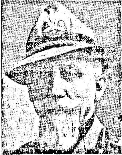
EMILIO DE BONO,

hogy az addis-abebei—džibuti-i vasutvonal rendkívül erős vonzerőt gyakorol majd, mint katonai célpont. Ugyanakkor azonban francia