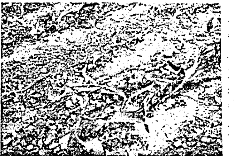
Nesupravegheată de specialiștii, prășia mecanică s-a făcut la C.A.P. Ghloroc și așa cum se vede în imagine, prin tăierea deopotriva a buruienilor și plantelor.