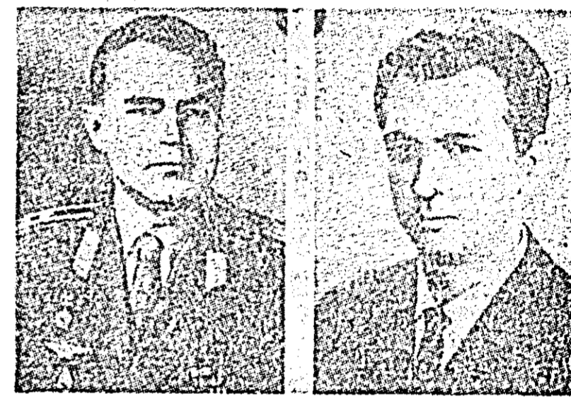
Proape trei săptămâni cosmonauții Andrian Nikolaev și Vitali Sevastianov au efectuat acest „maraton cosmic”.

Pentru efectuarea aterizării, la momentul calculat s-a procedat la orientarea — corespunzătoare a navei și a fost pus în funcțiune motorul de frinare. În momentul în care motoarele au încetat să acționeze s-a produs desprinderea compartimentelor navei, iar aparatul de coborîre, în care se afla echipajul, s-a plasat pe o trajectorie spre Pământ.